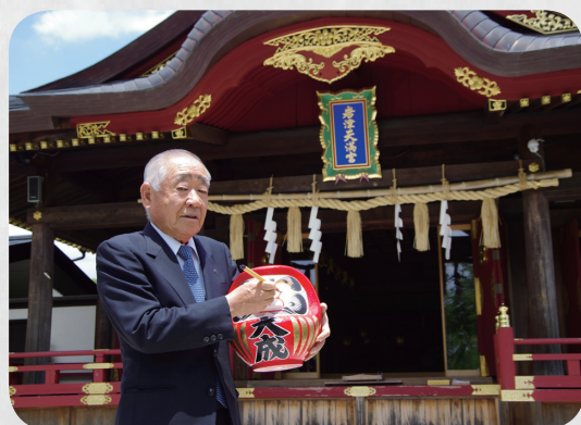
大成特地邀請開運達摩加持好運