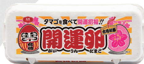
特選大成高品質產銷履歷雞蛋