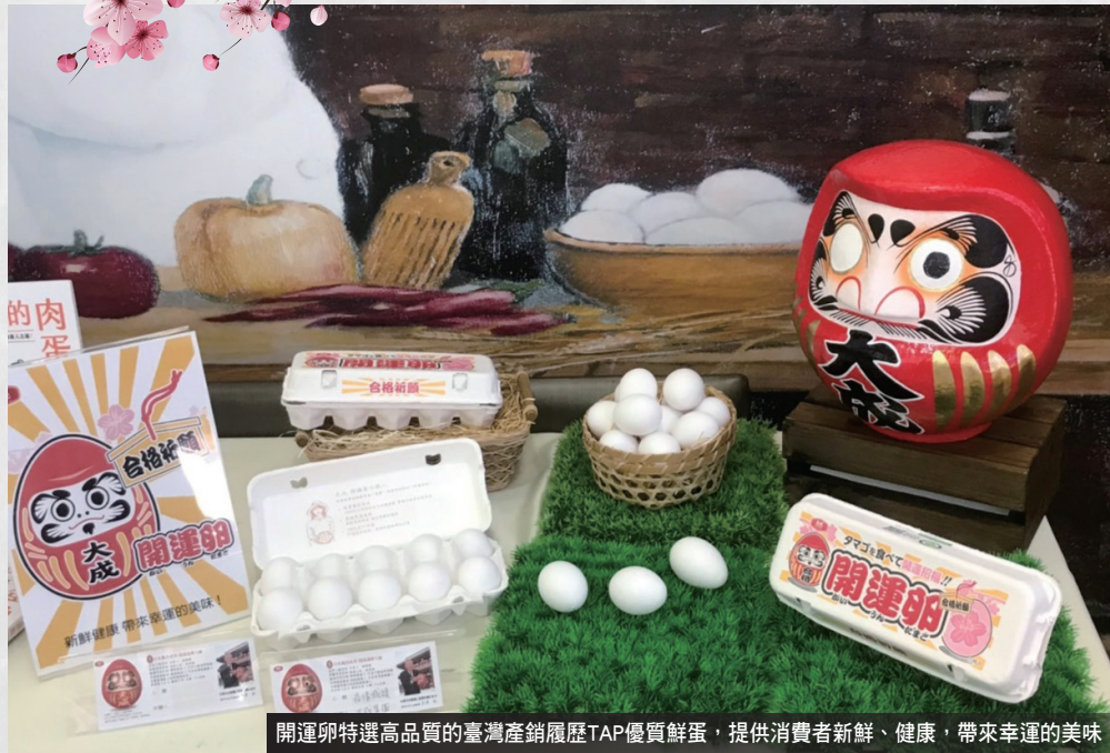
開運卵特選高品質的臺灣產銷履歷TAP優質鮮蛋，提供消費者新鮮、健康，帶來幸運的美味

在母雞產蛋後二十四小時內送達洗選場，在科學溫控環境下歷經檢查、洗淨、紫外線殺菌、風乾、選別、包裝、儲存等歷程。 大成並且建置一百臺雙溫層車輛，打造全臺最大蛋品運輸車隊，全程七度C以下配送，從母雞下蛋到送達賣場僅約兩天，以一條龍的嚴控作業，確保每顆雞蛋保有新鮮營養！享用大成出品的優質蛋品，除了在全國家樂福買得到之外，不妨前往臺北市士林區中正路上的「大成安心購」門市選購！