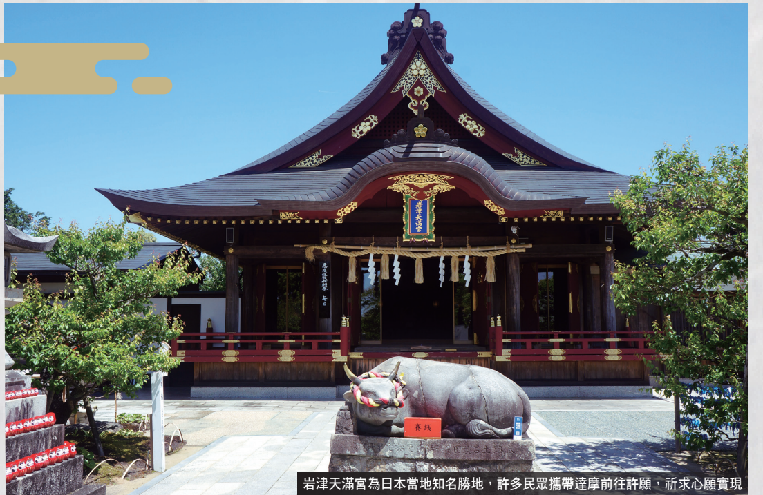
岩津天滿宮為日本當地知名勝地，許多民眾攜帶達摩前往許願，祈求心願實現