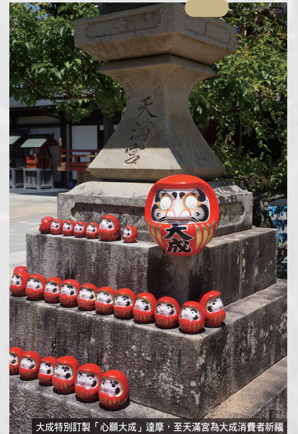
大成特別訂製「心願大成」達摩，至天滿宮為大成消費者祈福

理二百萬顆雞蛋。大成鮮蛋引領風潮，推陳出新，包括「葉黃素機能蛋1000」、「初生卵」、「DHA營養機能蛋」、大成CAS鮮蛋……等，帶動市場上的健康風潮！尤其是「葉黃素機能蛋1000」，歷經五年研發，在飼料中試驗加入十多種不同的天然添加養分，成功打造葉黃素含量達到每百公克一千微克的機能蛋，是市面上葉黃素含量最相對較高的雞蛋產品，守護3C產品過度使用的現代人！